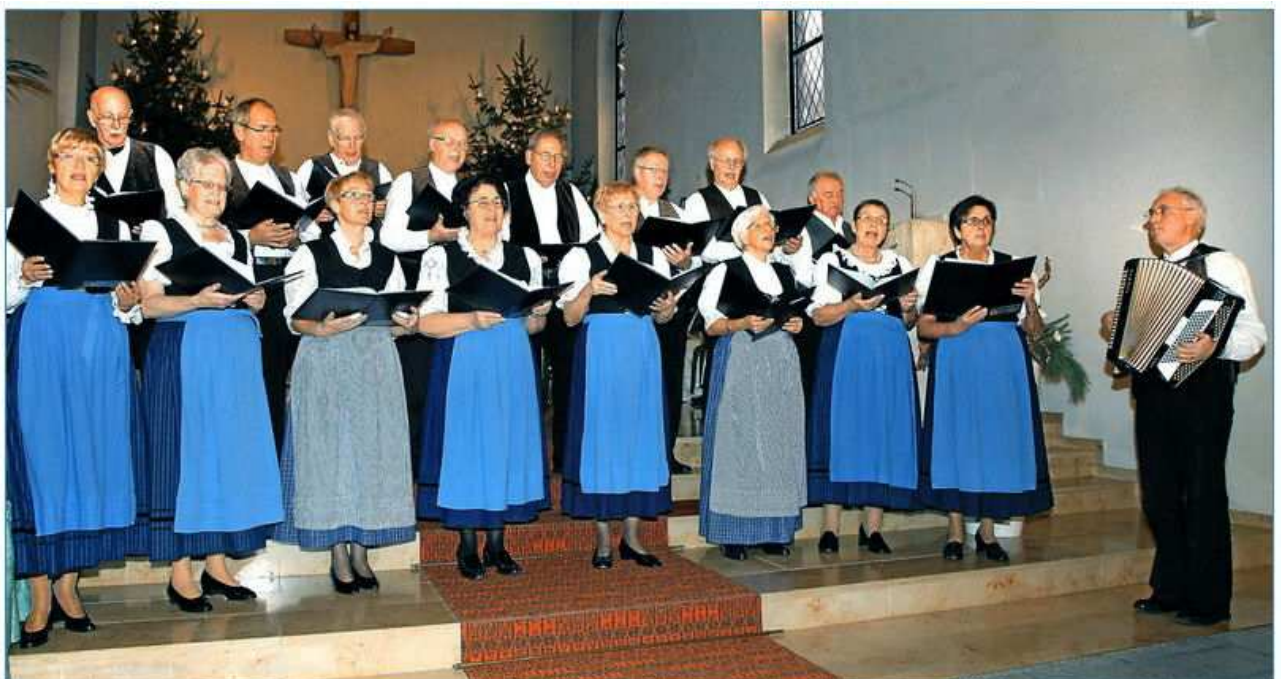
Die "Stockbirnscher" feierten ihr 25-jähriges Jubiläum mit einem Mundartgottesdienst in Mengerskirchen, wobei sie selbst verfasste Lieder vortrugen. | mittelhessen.de